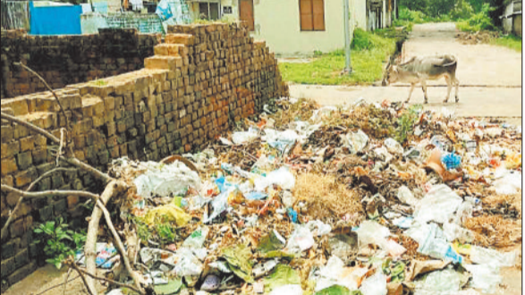
वाई में पसरती गंदगी।