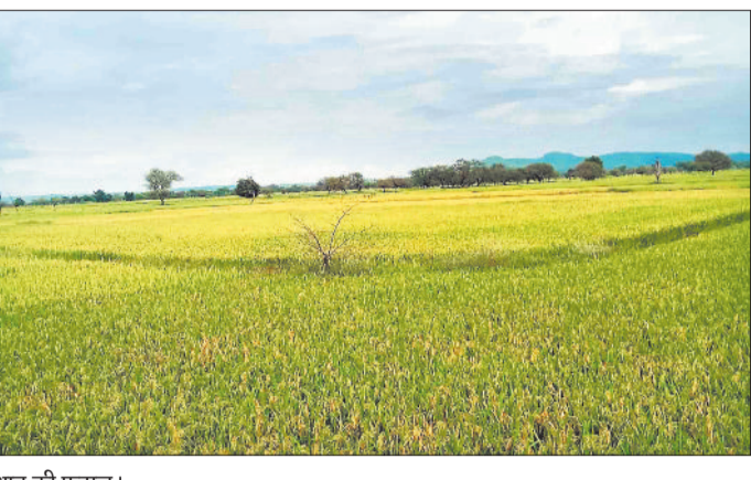
धान की फसल।

शासन द्वारा इस बार भी धान विक्रय के पूर्व गांव-गांव में किसानों के रकबे एवं फसल की स्थिति का सर्वे किया जा रहा है। राजस्व अमला हर किसान के खेत में लगाई गई फसल का आंकलन करता है जिसके आधार पर समितियों द्वारा धान की खरीदी की जाती है। इस बार गिरदावरी को पारदर्शी बनाने के साथ ही किसानों की भूमि उपयोग की सटीक जानकारी एकात्रित करने ऑनलाइन गिरदावरी की जा रही है। राजस्वकर्मी अपने कार्यक्षेत्र के गांवों का भ्रमण कर हर किसान के रकबे एवं भूमि उपयोग की जानकारी ऑनलाइन अपलोड कर रहे हैं। ऑनलाइन गिरदावरी की शुरूआत अगस्त में की गई थी जो अभी भी जारी है। सहकारी समितियों द्वारा पूर्व की