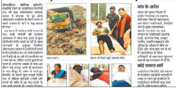
7 अक्टूबर को हरिभूमि में प्रकाशित खबर।