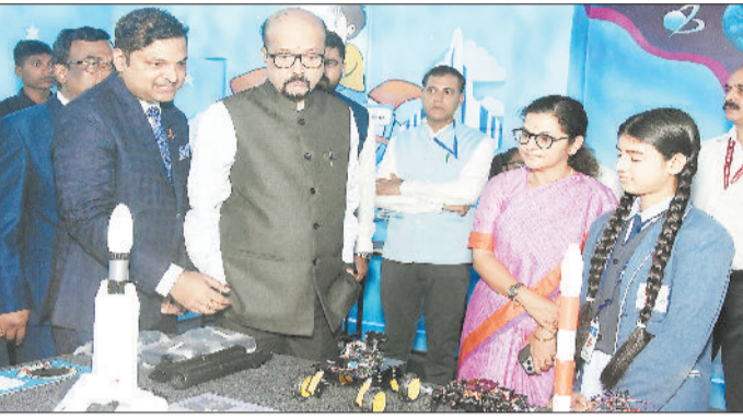
लैब का निरीक्षण करते राज्यपाल रमन डेका।

बैकुंठपुर। कोरिया जिले ने शिक्षा और विज्ञान के क्षेत्र में एक और ऐतिहासिक कदम बढ़ाते हुए मंगलवार को संभाग का पहला स्पेस एजुकेशन लैब स्थापित किया। छग के राज्यपाल रमन डेका ने बैकुंठपुर स्थित शासकीय आदर्श कन्या उच्चतर माध्यमिक विद्यालय में इस लैब का लोकार्पण किया। यह अत्याधुनिक लैब भारतीय अंतरिक्ष यात्री गुप कैप्टन शुभांशु शुक्ला के नाम पर समर्पित की गई है। डीएमएफ के सहयोग से स्थापित यह प्रयोगशाला विद्यार्थियों में अंतरिक्ष, भौतिकी, भूगोल और प्रौद्योगिकी के प्रति रुचि बढ़ाने में श्रेष्ठ भूमिका निभाएगा।